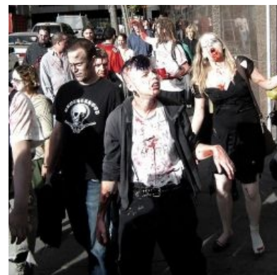
Рим — улица в час пик

В 1968 году вышел фильм Джорджа Ромеро «Night of the Living Dead» (снятый явно под впечатлением от «Птиц» Хичкока 1963 года), а потом — «Dawn of the Dead» (1978) и «Day of the Dead» (1985) . Первый был черно-белым, а в «Рассвете» зомби представляли собой чуваков, вымазанных синей краской и с кровью, текущей изо рта. Трэшевыми те фильмы назвать никак нельзя, они были довольно продвинутыми со сценарной точки зрения. Фильмов про зомби-апокалипсис много, но только у Ромеро был свой почерк, которого тупые уболлы так и не смогли разглядеть. А именно: мертвецы никогда не бывают в фокусе фильма (за исключением Баба из «Дня мертвецов», но в том состоит идея фильма) и не выступают в качестве антагонистов. Напротив, в этой роли выступает таки сама причина, заставляющая мёртвых вставать, а еще живых — становиться жертвами медленных, тупых, неуклюжих тварей. Притом не указывается источник лулзов — то ли спутник, упавший из космоса (тащемта, спутник — и есть причина зомби-апокалипсиса по Ромеро); то ли эксперименты военных (проделки злых комми ); то ли мало места в аду — что, несомненно, ещё более интригует и придаёт достоверности. После Ромеро пошёл настоящий трэш.