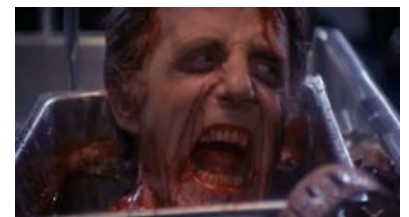
Порзйпить не вышло. RAAAAAAGE!!!