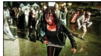
После концерта в Точке

Принято считать, что ромеровское (в целом не-трэшное) направление развития зомбифликов послужило нешуточным социальным комментарием и такой же сатирой на Америку соответствующих лет. При этом все подобные картины объединяет пристальное внимание к основным заморкам « постапокалиптического » зомби-фильма — последние живые, конец человечества, людская подлость и стадность, групповое поведение, « патроны бери, патроны! и тушенку! », способы лечения зомби, поведение правительства при БП и т. д.