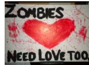
Зомби хотят твоей любви