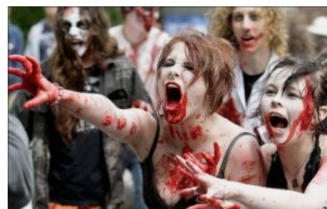
Ирландский электорат голосует на выборах в палату общин.

Стереотипный зомби вяло бродит по округе, пока не почувствует запах животинки, после чего резко пробуждается и с хрипом « BRAINSSSS » (единственное слово в лексиконе зомби, означающее