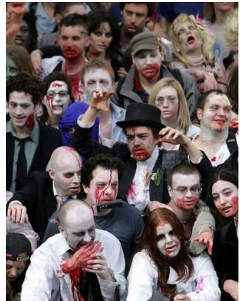
Забастовка венгерских сталеваров

Порошок попадает на слизистую оболочку глаз, очень быстро впитывается и вуаля . В итоге — смерть. Но если очень тщательно подобрать дозу, то можно на несколько суток парализовать жертву так, что все подумают, что она уже мертва. После похорон можно смело откапывать жертву и приводить её в чувство при помощи других сильнодействующих средств — микродозы яда древесной лягушки и живительных пиздюлей. Увы, из-за кислородного голодания очень много клеток мозга погибает, и в итоге мы имеем живой труп — безвольное существо без памяти и без чувств. Идеального работника для простейшей грязной работы .