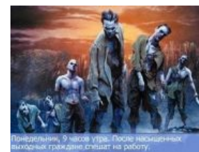
Граждане спешат на работу