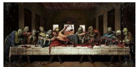
Вкусите тела христовоа...