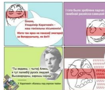
Говорят классики 2