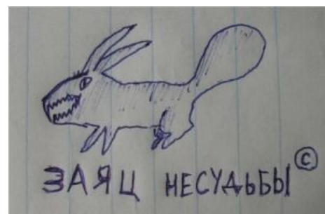
Обложка с тем самым зайцем

Пост с зайцем был настолько успешен, что за двое суток вошёл в двадцатку самых «рейтинговых» по Лепре. Естественно, в течение этой же пары суток какие-то кpіііісы , а скорее всего, сам автор, растащили контент по фишкам ( богомерзкая ссылка № 1 , не ходите по ней, богомерзкая ссылка № 2 , по ней тоже не ходите, чтобы не генерировать сучечкам трафик) без всякого упоминания автора или хотя бы источника.