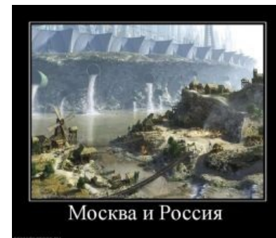
Истина где-то рядом...

Каждый замкадыш мечтает понаехать в Москву. Ведь по слухам там все богатые, и местный Вован тоже хочет стать богатым. Ведь замкадыш, если живет в деревне, то работает на комбайне либо пасет коров, а если в городишке, то продавцом или таксистом, зарабатывая в обоих случаях около 10 косарей. Приезжая в нерезиновую, Вован проходит несколько ступеней эволюции, они описаны ниже.