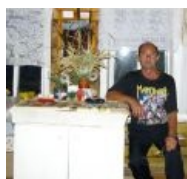
Типичный замкадский студент-фанат ВИА Manowar в типичной замкадной землянке