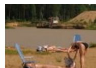
Пляжи Замкадья такие пляжи