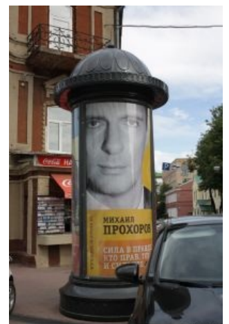
Озалупленный Михаил Прохоров

Дословно означает сугубо физиологический процесс, заключающийся в оголении головки мужского полового члена путём отведения крайней плоти. В жизненном цикле одноклеточного имеет переломное значение, потому что означает отсутствие фимоза у поциента (но это опять же, исключительно физиологически). Также существует миф, что не разлупившиеся школьники не могут иметь полноценного секса с другим человеком, ввиду несовместимости фимозного члена и презерватива. Несмотря на то, что данный миф совершенно лишён смысла, британские учёные располагают сведениями, что школьники в принципе не могут иметь полноценного секса, и фимоз здесь ни причём , %username% . Алсо, особо одарёнными пациентами используется в значении «ударить». В музыкальных и не только краях глагол «залупить» обозначает «поставить/завести в цикл». Часто применяется музыкантами, юзающими Loop station. Тащемта, и программисты частенько ругаются таким вот неологизмом.