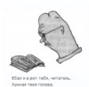
Читатель-залупа, возможно первый человек-залупа в этой стране .