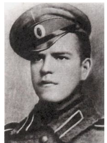
Жуков молод и brutalен

Следующую яойную вылазку мунспикеры сделали