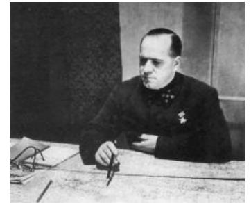
Немцы рвутся к Москве? Мы работаем над этим.

В конце июля 1938 года 7 тыс. япов ВНЕЗАПНО набигают на мирных приморских колхозников на озере Хасан, с целью немного подправить госграницу в свою пользу. Находящиеся там 23к советских войск были немного не готовы к такому закидону, поэтому фронт покотился в сраное говно, и советам пришлось идти на мирную. Потери СССР неизвестны, анимешники говорят о 10 тыс. Потери япов максимум 600 [ЦИТО?] . Обе стороны провозгласили феерическую победу, только вот наше военное руководство почему-то поехало отдыхать в лагерь, в один конец.