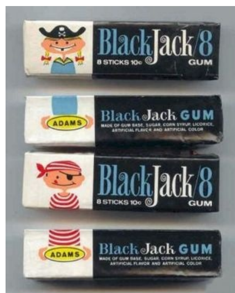
Шлюхи были после

В тридцатых годах двадцатого века Ригли изобретает хитрый план по увеличению продаж розовой массы