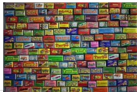
Жвачка. Много её.