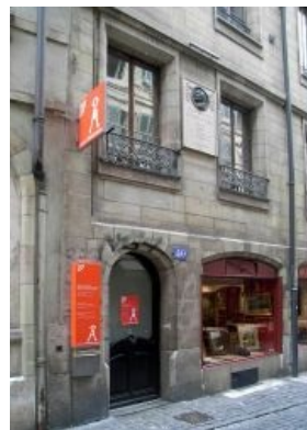
Дом, где родился Руссо