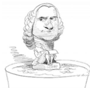
Вы все пидарасы — а я Жан-Жак Руссо!