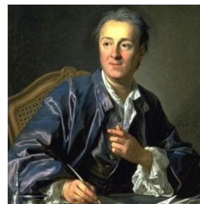
Дидро: «Жан-Жак, ну ты, блин, отжёл со своим трактатом!»

Однажды Дидро в очередной раз упекли в тюрьму, и Жан-Жак отправился навещать кента. По пути он прочитал в газете объявление о том, что Дижонская академия объявляет конкурс сочинений на тему «Содействовало ли возрождение наук и художеств очищению нравов». ВНЕЗАПНО на Руссо снизошло просветление , пришедший в голову ответ вызвал такой приход , что Исаакович полчаса лежал под придорожным деревом, а когда очнулся, то весь жилет его был мокрым от блево тины слёз. Мысль, осенившая Жан-Жака, заключалась в том, что просвещение вредно, а культура есть ложь, пиздёж и провокация . «О Всемогущий Господь, избавь нас от просвещения отцов наших и приведи нас назад к простоте, невинности и бедности!» — воскликнул Руссо.