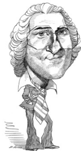
Карикатура на Руссо