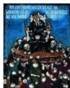
Картина Хейдиз из собрания Московского музея современного искусства.