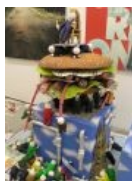
Скульптурный монумент Лены Хейдиз.