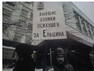
А тут, понимаешь, элехторат!