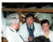
Ельцин и Аццкая сотона.