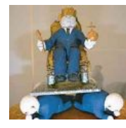
Фрагмент памятника ЕБНу работы Хейдиз.