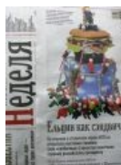
Говноизвестия пишут о памятниках ЕБНу.