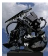
Памятник мог бы быть и таким. Символизирует «деструкцию и распад, поглощение упорядоченности хаосом».