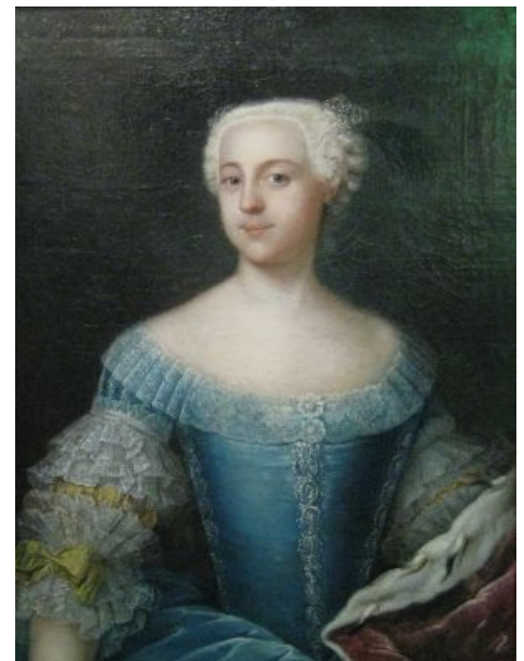
Няшка Фике в начале славного пути...

Итоги деятельности: становление России великой державой