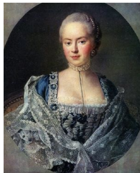
Салтычиха смотрит на тебя как на будущую жертву

В начале царствования Катюхи, при покупке целыми деревнями, душа с землёй оценивалась в среднем в 30 рублей, после учреждения в 1786 году заёмного банка цена поднялась до 80 р., а в конце екатерининской эпохи вообще трудно было купить имение дешевле 100 р. за душу. При розничной продаже здоровый работник, покупавшийся в рекруты, стоил 120 деревянных в начале царствования и 400 в конце оного. После 1785 года крепостной крестьянин по сути признавался составной частью