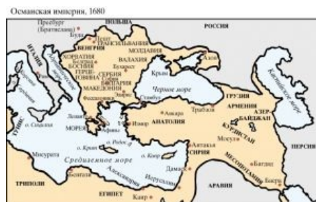
Жирный кусок карты Османской империи