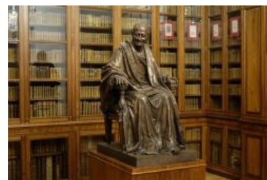
Бронзовый Вольтер со своей библиотекой в Питере

«Именно он, вернее, его труды, сформировали мой разум и мои убеждения. Я вам уже говорила не раз, что, будучи моложе, я желала ему нравиться. »