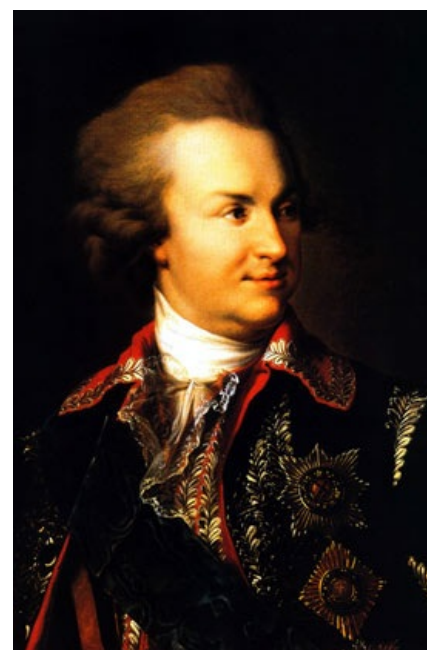
Потёмкин. Весь такой Таврический. Аффт р большей части проекта

личного секретаря графа Александра Безбородко Катя изложила план беспардонного захвата всей Османской империи и заодно передел всей Юго-Восточной Европы, приправив басню красочным описанием художеств турок. Мол, в османской диванной канцелярии нагло пиздят казну и притом не пускают русские корабли через Босфор и Дарданеллы, паши плюют на автономные права дунайских княжеств, разбойнички грабят целые города и сёла, янычары торгуют какой-то хуйнёй в лавках, откуда их, гадин, и за шкуру не вытащишь; христиане же баттхёртят, готовые восстать и устроить тотал экстерминатус . После шли убедительные очковтирания насчёт справедливых решений, мол, всё будет «в соответствии с официальными договорами». Затем предлагалось запилить «буферное» христианское государство Дакию — потом ту территорию нарекут Румынией.