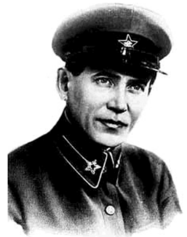
Барак-Обама Николай Ежов