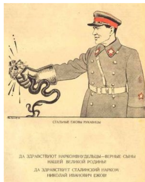
«Ежовы рукавицы» — знаменитый плакат Бориса Ефимова

— Нержавеющей стали Хозяин возмущается заржавевшим железным наркомом