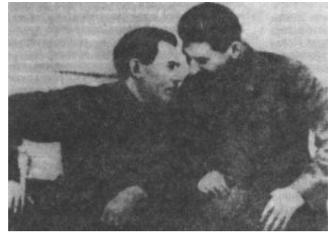
За секунду до поцелуя

В историю Ежов вошёл как образец карликового сферического НКВДшника в вакууме, символизирующего всё зло, которое таит в себе Кровавая Гебня. По характеру тов. Ежов был на 100% тов. Шариков, а потому и котов на посту наркома он душил-передушил столько, что ещё до его отставки всё это безобразие стали именовать «ежовщиной». Даже его ближайшее окружение небезосновательно опасалось, что Коля неиллюзорно взял курс на лозунг УВЧ. Только по официальным данным за время доминирования Ежова в стране было вынесено 681 692 смертных приговоров из максимум 900 000 всех смертных приговоров, вынесенных при Сталине (практически 75% всех расстрелов), что даёт нам около 1000 вышек в день. Путём нехитрых вычислений можно прийти к выводу, что за оставшиеся 27 лет правления Кобы было расстреляно уж никак не более 200 000 человек, что за такой срок не слишком-то и много. Так-то.