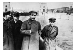
До 1938 года

В СССР 1930-х годов Фотошоп был, но не компьютерный . Что, однако, не мешало тогдашним умельцам правильно преподносить информацию широким массам. Когда Николашка был на высоте, он много и с удовольствием фоткался рядом с отцом народов, благо тот был не против. Но после того, как Ежов был предан анафеме, эти фотографии, ммм... стало как-то неудобно показывать народу. В итоге Ежов стал волшебным образом исчезать из официальных снимков того времени. Самый известный пример показывает Ежова бодро вышагивающим со злобной ухмылкой на лице рядом со Сталиным и Ко вдоль свежевыстроенного канала «Москва — Волга». После ареста Ежова на той же фотке вместо наркома лишь пустое место . Вуаля!