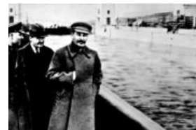
После 1938 года. Дэвид Блейн отдыхает

Народный комиссар внутренних дел СССР Генеральный комиссар государственной безопасности тов. Николай Иванович Ежов был прославлен в веках известными писателями .