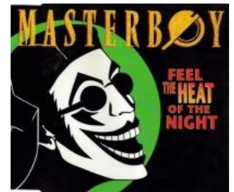
Почувствуй пламя ночи

В марте 1996 г. Masterboy продюсируют трек « Love Message ». Для записи они приглашают таких звёзд немецкой танц-сцены как Mr. President, E-Rotic, Fun Factory, Scooter, U96. Сингл является благотворительной акцией против СПИДа и получает золотой статус в Европе, а также занимает 3-е место в Media Control Single Charts. На волне внимания к глобальной проблеме современности вскоре записывается ещё один благотворительный релиз « Children Need A Helpin' Hand ». Помимо Masterboy, в записи приняли участие DJ BoBo, 'N Sync, Captain Jack, Mr. President и внезапно Backstreet Boys. Томми и Энрико продюсируют проекты Ice MC, Mr. President и Worlds Apart. Masterboy вместе с группами Captain Jack, Mr. President и другими участвует в большом Mega Dance фестивале по всей Германии, который проходил аж до середины октября. За это время группа побывала в 18 главных городах своей родины.