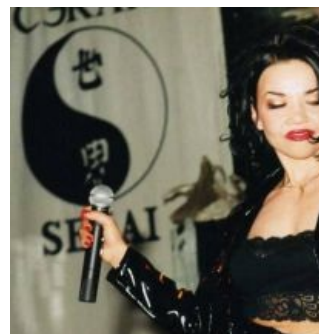
Микрофон на фоне бюста Натали намекает

Эта ваша пресловутая коммерция создала евродэнс, она же его и убила. Помимо более-менее успешных групп имелось огромное количество проектов с одним-двумя хитами. Старые исполнители выдыхались в