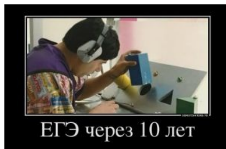
Прогноз для путинской Рашки.