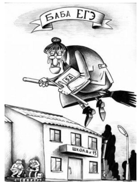
Тень нависла над Иннсмутом...

Однажды некий доблестный долбоеб вскрыл до экзамена конверт, который ему поручили отнести директору. И не только ведь вскрыл, но еще и умудрился выложить задания, находившиеся в этом конверте, в интернет. Распиздяйство преподавательского состава школы не позволило обнаружить факт вскрытия конверта еще до экзамена, поэтому после него, когда в