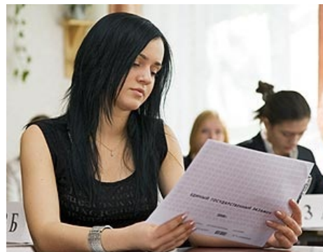
Бланк смотрит на ГК как на говно.