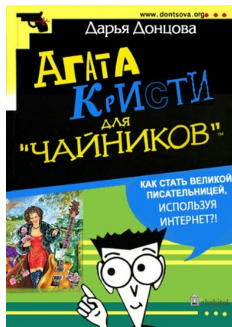
Детектив для чайников