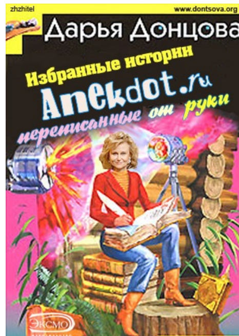
Обложка, подходящая для любой книги Донцовой