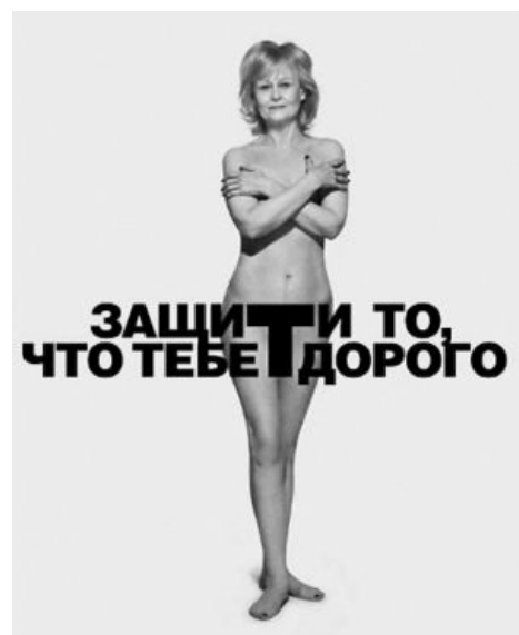
Агитирует за сомнительную фармакологию