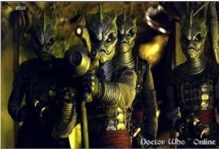
Ктулху фхтагн! А теперь умри.

звание самой страшной в сериале. Больше всего кирпичей высирается после фразы доктора: «Они не в каждой тени, но могут быть в любой». Двоят тень жертвы перед её гибелью, так что можно высрать ещё больше кирпичей, если попасть под 2 источника света после просмотра. Последний факт создает еще одну страшную фразу «У тебя двоится тень». Доктор никак не может помочь тем, кого Вашта выбрали своей целью, что выражено его словами «Мне жаль. Мне очень, очень жаль, но у тебя две тени», сказанными первой жертве. Так что если в сериале у Вас две тени - Вы умрете.