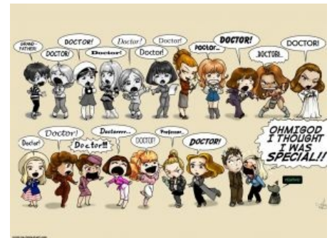
Все Доктор-Тян из классики!

В классических сериях спутники, зачастую, выглядели «расходным материалом», что обуславливалось спецификой сериального формата: актёр в любой момент мог прервать отношения с телекомпанией, и тогда в очередную серию быстро дописывался эпизод «спутник покидает Доктора». Это приводило к несуразным сюжетам, например «Первый Доктор по желанию левой пятки бросил родную внучку на разрушенной далеками планете в объятиях полужнакомого мужика». С современным Доктором сниматься почетнее, да и контракты для актеров нынче куда строже составляются, что позволяет сценаристам вбросить ДРАМЫ в отношения Доктора со своими спутниками.