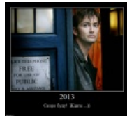
Скоро буду! Ждите...))