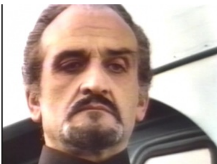
Я — Мастер, и ТЫ будешь мне подчиняться!

В классических сериях спутники, зачастую, выглядели «расходным материалом», что обуславливалось спецификой сериального формата: актёр в любой момент мог прервать отношения с телекомпанией, и тогда в очередную серию быстро дописывался эпизод «спутник покидает Доктора». Это приводило к несуразным сюжетам, например «Первый Доктор по желанию левой пятки бросил родную внучку на разрушенной далеками планете в объятиях полужнакомого мужика». С современным Доктором сниматься почетнее, да и контракты для актеров нынче куда строже составляются, что позволяет сценаристам вбросить ДРАМЫ в отношения Доктора со своими спутниками.