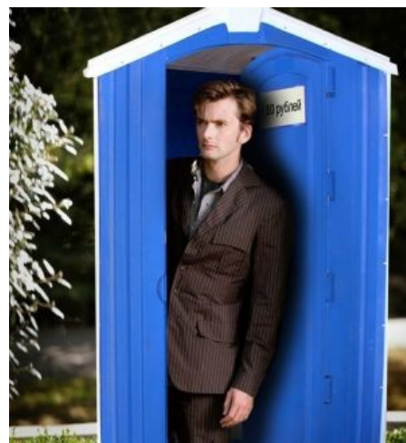
Человек из синей будки