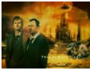
This is Gallifrey.