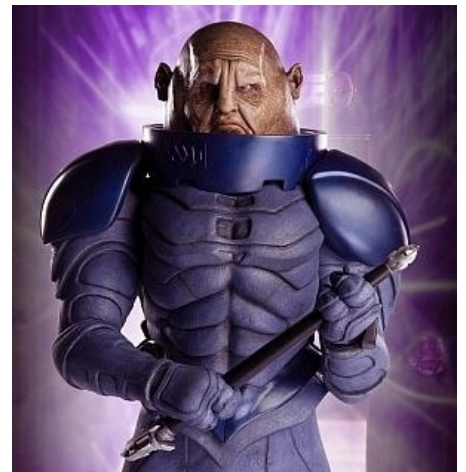
Сонтаранец смотрит на тебя как на печёную картошку.