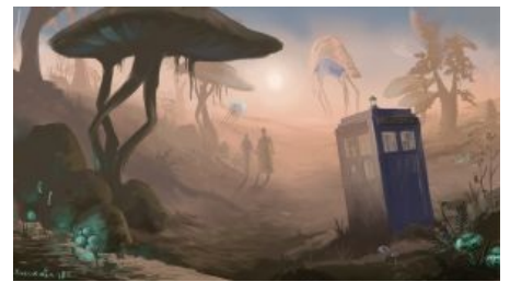
Доктор прибыл в Морровинд

Doctor Who: The Hitchhiker's Guide to the Daleks Далеки в Путеводителе