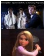
Сковородка — оружие свободы не только у Рапунцель.