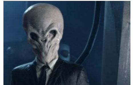
При чём тут люди в чёрном...

обезьян. Главной особенностью является то, что их помнишь, только пока они в поле зрения. Стоит лишь отвернуться, и все воспоминания о них тут же стираются. ( спойлер : Исповедавшийся сразу забывает кому и в чём исповедался.) Внешне похожи на Слендерменов, только с глазами. Как никто умеют намекать — если они показывают на вас пальцем и делают рот кружочком — знайте: через вас сейчас пропустят пару тысяч вольт. Спутники доктора приучились делать метки на руках (и не только руках) при каждой встрече инопланетян этого вида и высирать тонну кирпичей по обнаружении этих меток на своей коже. В последней серии шестого сезона был предьявлен более действенный метод — особые налочки на глаз, соединяющиеся с участком мозга, отвечающим за память. Правда, в конце концов ( спойлер : они обернулись против своих носителей). Там же, к слову, солдаты проявляют неестественную тупость, потряхивая оружием и не стреляя из него. Дело в том, что анатомически они (инопланетяне) так же хрупки, как и люди. То есть парочка пуль в живот или в голову — прости-прощай, Тихий.