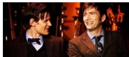
Пока ты шликаешь , они

Десятый был весёлым, храбрым красавцем с милой улыбкой, ходил в костюмчиках с кедами и взрывал мозг юным фанаткам. Был образцовым Д'Артаньяном, любил Розу Тайлер, которую благополучно проебал во втором сезоне в параллельном мире ( спойлер : Но потом случайно клонировался, и вторая, не бессмертная версия досталась Розе), а затем пафосно хранил ей верность, отказывая последующим спутницам (на самом деле просто так повелось с олдскула — Доктор асексуален и ему похуй на спермотоксикоз, так что спутниц он посылал just for lulz ). Из