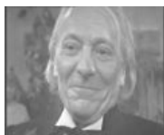
Доктор улыбается тупости окружающих