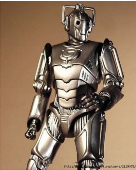
Киберчеловек во всей красе.

фигурирует промежуточный вариант, но это исключение), раса киборгизированных гуманоидов с блуждающей планеты. Отличительная черта — уши киборгов закрыты устройством, контролирующим их мозг. В сериях Первого Доктора появляются киборги второго типа с чем-то вроде наушников. В новых сериях — это две голубозубых гарнитуры в обеих ушах. Как и Далеки, являются частью сериала и шаблонными злодеями. Слабее далеков в over9000 раз (в серии «Судный день» четверо далеков без труда выпиливали сотни киберлюдей, хотя, конечно же, хватило бы одного), зато крайне многочисленны .