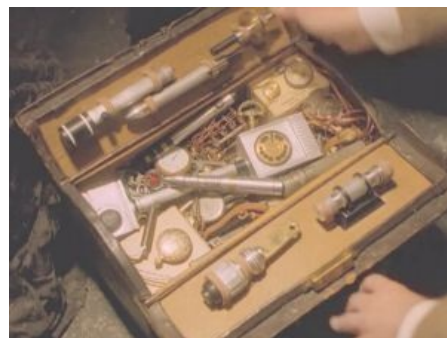
Набор инструментов Восьмого Доктора