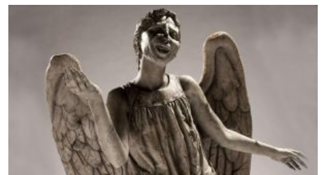
Во всей красе.