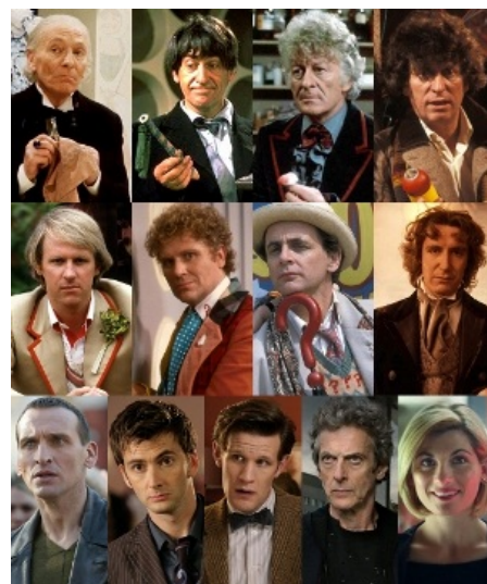
Все лица Доктора

Появился на свет он в 1963-м и жив по сей день, хотя ни один Нострадамус не мог даже помыслить, что так