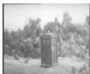
Спецэффекты 1963 года