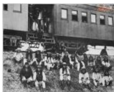
Заклѳчѳнные индейцы и среди них великий Джеронимо (спереди справа) смотрят на тебя как на угнетателя