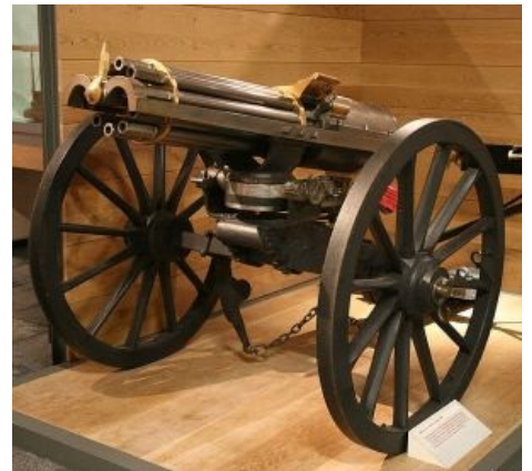
Орудие Гатлинга так и норовит сделать в тебе несколько дырок