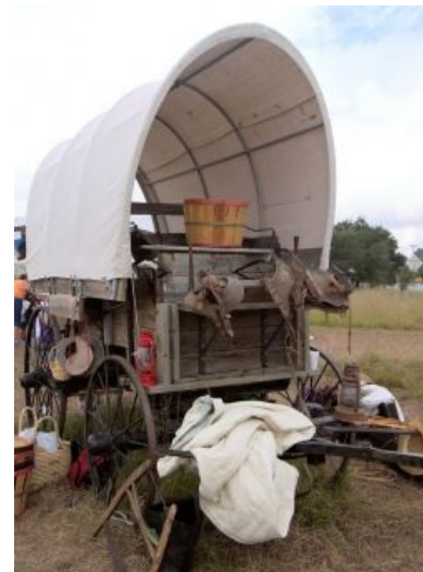
Wagon как он есть