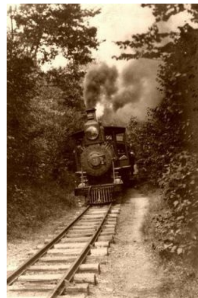
Паровоз на рельсах

Именно с этим периодом истории связано бурное строительство железнодорожного транспорта, а, значит, с эпохой плотно переплелись локомотивы, вагоны, вагонетки, дрезины, рельсы и т.п. Равно как и все связанное с паровыми машинами — свистящими, испускающими струи пара и клубы дыма и искр. Стимпанк как эстетическое явление очень много вобрал в себя из атрибутики фронта. Строителями железных дорог были хобо и кули . Хобо — строители железной дороги, по причине нищенской зарплаты, смахивающие образом жизни на полубомжей . Американские хобо — это полный аналог сибирских бичей времён строительства Байкало-Амурской магистрали — опустившиеся разнорабочие, которые, однако, не попрошайничают, а честно пытаются заработать себе на бутылку. Кули — китайские жёлтые чернорабочие , наряду с хобо представляли собой основных строителей железных дорог, поскольку рабочих согласных горбатиться за гроши не хватало, а нормально платить жаба душила, то строить железные дороги завозили гастарбайтеров. Именно для них и писались законы, запрещавшие жениться азиатам на белых (запрещено было, как упомянуто выше, отнюдь не везде). А поскольку в качестве кули , как правило, завозили мужиков, а не женщин, то часть афроамериканцев имеет ещё и азиатские корни.