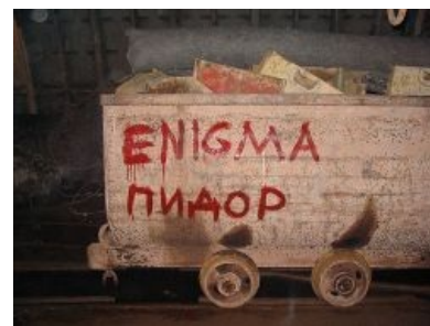
Транспорт настоящего диггера