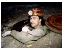
Шаблон для шуточек про диггеров и метрокрыс