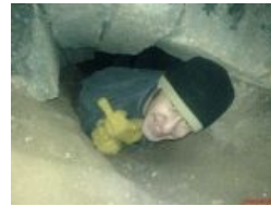
Как-то так они и рождаются