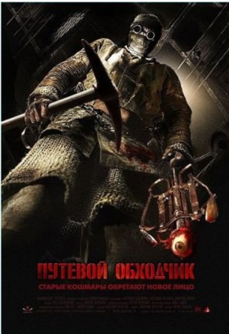
Российский ужастик про метро. Главная НЁХ — возможно, бывший диггер. Колыбельная равнодушной не оставит

надо сразу выкладывать отчёт о походе века во все известные диггерские паблики (ну, если не фоткал на объекте хорошенькую полуголую тят): все там давно уже побывали, и виртуальный рейтинг анона тут же упадёт с нуля до минус бесконечности, после чего брэнное тело будет подвергнуто осмеянию и скорому бану.