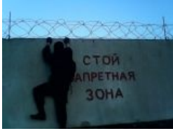
О! Нам сюда!