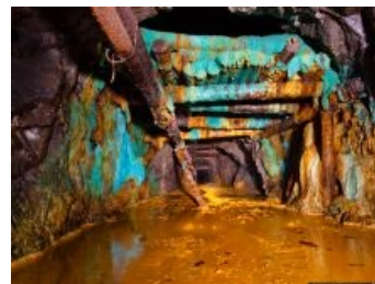
Заброшенная шахта и вещества, а может, и нет