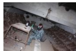
Лавочка на спецобъекте, +100 к эпичности пьянки