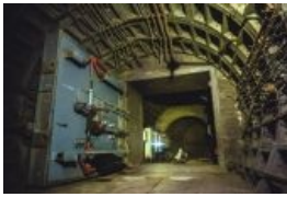
Гермодверь в метро