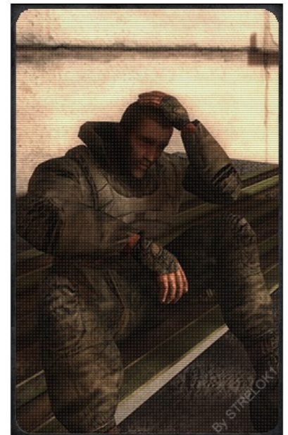
Виртуальный диггер в унынии от своих реальных прототипов