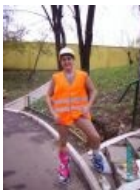
Когда очень хочется лазить по канализации