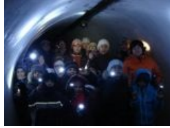
Уже завтра на твоём объекте, если сфоткал залаз и не замаскировал