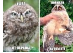
Суть многих полазок