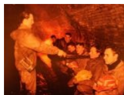
ВадМих посвящает в диггеры — а ты думал, что достаточно просто залезть в люк?