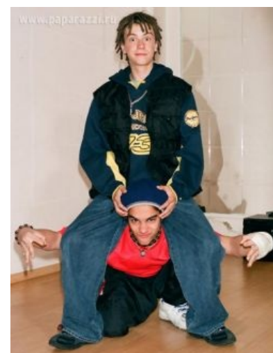
Тимати нашёл своё место в жизни

Децл ( IRL Кирилл Толмацкий , евр. рас. : לורק, каш. Поцл , введен в эксплуатацию 22 июля 1983, выведен 03 февраля 2019, от фанатов скрывался позднее под ником Le Truk ) — историческая рэп-фигура конца 90-х — начала нулевых, представлявшая собой переходное звено между обезьяной и человеком с какашками , вылезаящими из головы . Исполнял ртом различные куски текста , схожие с песнями . Являлся апофеозом и наиболее точным собирательным образом российской рэп- и хип-хоп- культуры, состоящей, в основном, как раз из подобных личностей. Таки считал себя ЕРЖ в этой стране (по отцовской линии ). Его бывший друг Тимати — тоже ЕРЖ (но уже по матери ), что символизирует.