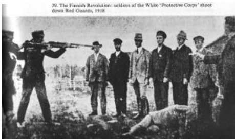
39. The Finnish Revolution: soldiers of the White "Protective Corps" shoot down Red Guards, 1918

ходе так называемой « лотереи Хуруслаhti », разыгранной на льду одноимённой речки. Свидомые финские историки утверждают, что эти восемьдесят были выбраны не случайно, а являлись самыми что ни на есть жидами и комиссарами , а это уже кошерно по Женевской Конвенции 1864 года. WAIT, OH SHI~