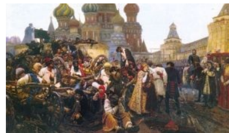
Суриков, «Утро стрелецкой казни» a.k.a. «Петенькины лулзы»

Полки, или роты, которые с неприятелем в бой вступя, побегут, имеют в генеральном военном суде суждены быть. И есть ли найдется, что начальныя причиною тому были, оным шпага от палача переломлена и оныя шельмованы, а потом повешены будут. А ежели начальныя и рядовыя в том преступили, то начальныя, как выше сего упомянуто, накажутся, а из рядовых по жеребью десятой (или как по изобретению дела положено будет) повешен, а прочие шпицрутенами наказаны будут, и сверх того без знамен вне обоза стоять имеют, пока они храбрыми своими делами паки заслужат. Бude же кто невинность свою оказать может, оный пощаду свою получит.