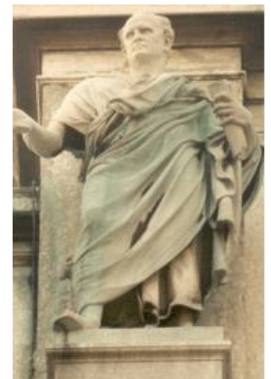
Римский Жуков был даже похож на нашего фигурой

Понятие «круговая порука» упоминается уже в самом первом известном отечественном правовом кодексе «Русская Правда», сформулировавшем отношения между гражданскими. А восходит эта концепция к Торе , к чему ж ещё? Если все ответственны за промах соседа, то все будут за всеми следить и можно сэкономить на