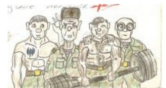
Вся команда в сборе: спортсмен, сержант с маленьким окладом , тарзан и Номад