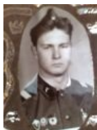
Суровый дембель суров