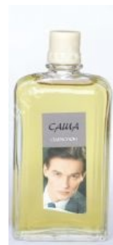
Одеколон «Саша» с пробкой типа «Слоник»

Некоторые пробки белого цвета также были неликвидны, ввиду их большой распространенности. Треснутые пробки также не считались ликвидом.