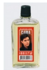
Снова «Саша», но с пробкой типа «Безбойка»