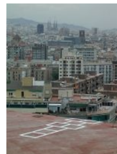
Советские классики, бессмысленные и беспощадные. ЧСХ, в Барселоне.