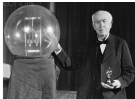
Уже пожилой Томми и его творение

Отсутствие двигателей переменного тока и трансформаторов однозначно определяет выбор в пользу постоянного тока. Через 4 года заработали первые электростанции в Лондоне и Манхэттене, а ещё через пять около сотни насчитывалось в одних только Штатах.