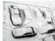
Стоило с подснежниками.

С дачниками тесно связана совершенно особая группа автовладельцев — подснежники. Как уже замечено, основная активность дачников наблюдается в летний период, зимой же — традиционный период спячки (и улячки ). Поэтому на зиму огромное количество автомобилей встает на прикол. Конечно, причиной тому не только отсутствие озимых на частных участках, но и попытка сэкономить, ибо зимняя езда подразумевает как нормальное состояние авто (иначе оно просто не заведётся в мороз), так и большие расходы на содержание: большой расход топлива, зимние шины, омывка и прочие радости. Так и стоят они во дворах, превращаясь в аккумулятивные и не очень сугробы. С началом дачного сезона оттаявшие машинки бодро устремляются к своей цели (если за зиму не спиздили всё что отвинчивается и отдирается), причём зачастую это первая поездка дачника после полугодового перерыва. В совкупности с резким увеличением плотности движения за счет таких же, неадекватных после спячки, подснежников это дает вполне предсказуемый результат — локальный пиздец и ненависть со стороны ездящих круглогодично.