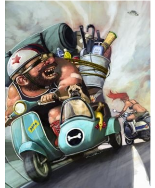
Герой статьи по пути на дачу.