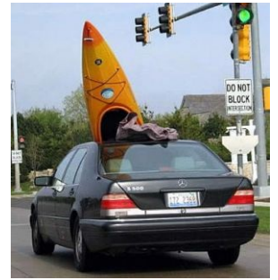
На дачу по-американски. Алсо, 600– okay, 500-ый мерин

По состоянию на 28/02/2017 (программе 9 месяцев, для земель Приморья — 5 месяцев, для жителей НЕ прописанных на Дальнем Востоке — месяц) по заявкам землю получили менее 10% подавателей заявок (6166 из овер 67000)