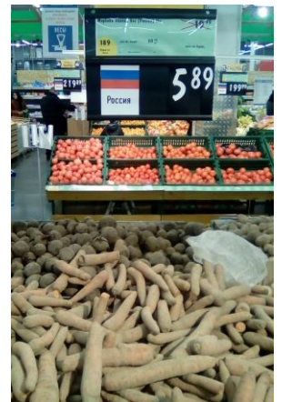
ОХ БИЗ ДАЧИ СИЧАС НИКУДА-А-А.

«Жительница Перми устроила на своем садовом участке импровизированное кладбище, заживо похоронив свою мать-инвалида и подругу. »