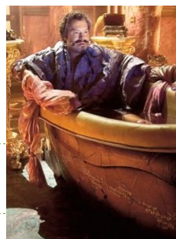
...и Обитаемый остров

Если ты видишь это сообщение — значит ты мудака у тебя отключен javascript (потому что ты мудака). Просмотр данной страницы рекомендуется со включенным JS. Так что тебя предупредили.