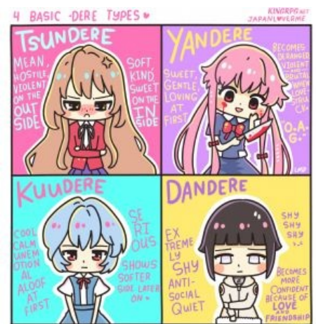
Четыре столпа-архетипа рисованных тян

Другой перевод «дередере» — сентиментальная , потому не стоит полагать, будто дандере является дандере только при непосредственном наличии возлюбленного куна . Условие будет выполнено, достаточно лишь быть стеснительной и сентиментальной .