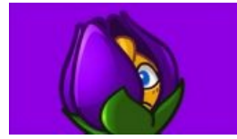
Стеснительная и фиолетовая , буквально