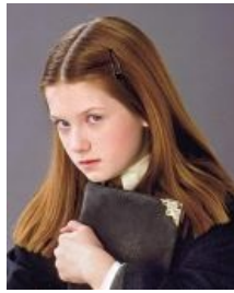
Визли-младшая (первые 4 книги)