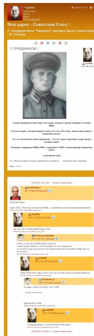
Пример гутниковского красноречия. Nuff Said

Еще любит он стучать, правда, в виртуале,