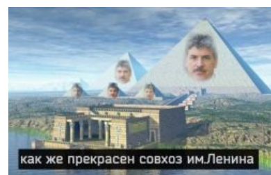
Оригинальное фото совхоза, снятое дроном ФБК Навального