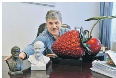
Усы и прочие реквизиты в наличии

Грудинин Павел Николаевич (он же Кандидат от народа , Клубничный король , главный редактор крупной Нью-Йоркской газеты , ярый поклонник эффективного менеджера Сталина , чёрт из табакерки , и наконец, коммунист-олигарх ) — (спойлер: очередной успешный проект по повышению явки на выборах в масштабах одной, отдельно взятой страны.) Один из участников развлекательной группы потешных кандидатов на телешоу «Выборы президента Путина-2018 », а также действующий директор ЗАО под названием «Совхоз имени Ленина», что у многих просоветских и не очень граждан вызывает неконтролируемую эрекцию, а у нормальных людей фейспалм, ибо «Закрытое акционерное общество» и «Советское хозяйство» — это сочетание несочетаемого .