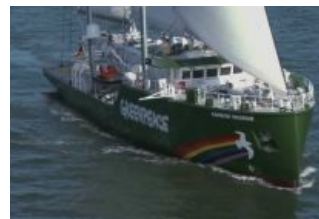
Белеет прус одинокий