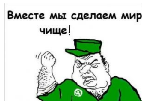
Суть организации одной картинкой

«На космическом корабле, под названием Земля, нет пассажиров. Мы все – экипаж. »