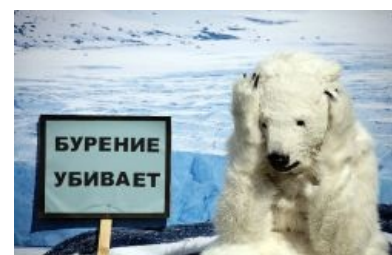
Чучело упоротого медведя недоволено бурением в Арктике

В середине 90-х у Гринписа резко обострилась гражданская позиция против нефтедобывающих компаний. Поводом послужил 150-метровый буй-танкер Brent spar. Компании Shell он надоел, и было принято решение затопить его нахуй, оросив окрестности остатками нефти. В ответ активисты Гринписа приковали себя к этому бую и затащили вой во всех СМИ, заодно приукрасив в тридцать раз количество оставшейся на борту нефти. Граждане прочувствовались, стали бойкотировать заправки, одну обстреляли, две чуть не сожгли. От происходящего в Shell окончательно ахуели, отбуксировали платформу к берегу и таки распилили. Однако, хитрожопые нефтяники перед распилом провели независимый аудит, который подтвердил, что в оценке остатков нефти была права Shell. Гринпису пришлось извиниться. Вроде бы win, но таки fail.