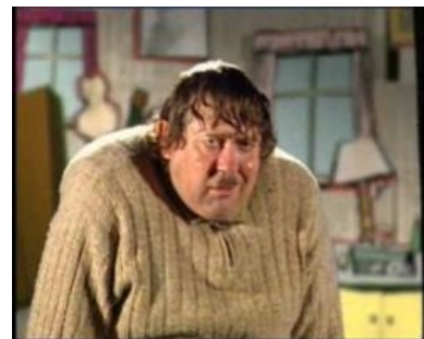
Модест такой Модест