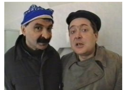
Вот эти ребята