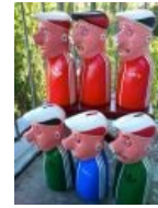
Копилки для реальных пацанчиков