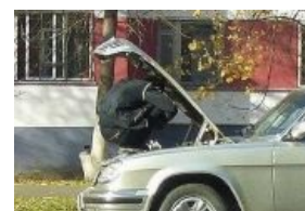
В привычной позе