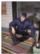
Ди сюда на!