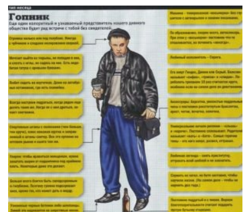
В «типах месяца»