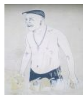
Пляжный вариант. Настенная живопись Донецка