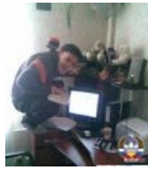
В интернетах, шаблон на нашей плашке