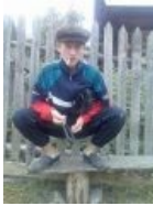
Барсетка, катки, дорогой спортивный костюм и кэпка — в натуре поднялся чисто в колхозе