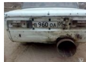
Чо-чо? Опа нихуя!