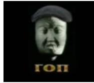
Телекомпания ГОП представляет...