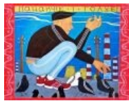
Работа укрского художника Ивана Семесюка