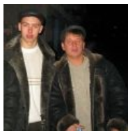
Ставший популярным типаж