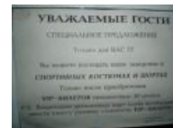
Спецпредложение для самых чотких