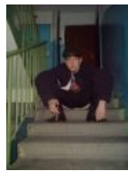
Правильная посадка, ставится в пенитенциарных заведениях