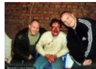
Приезжайте к нам в Урюпинск