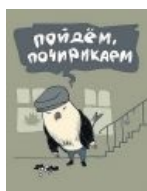
В мире животных