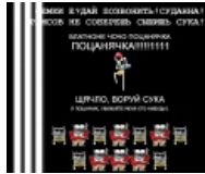
Упячка тоже в теме