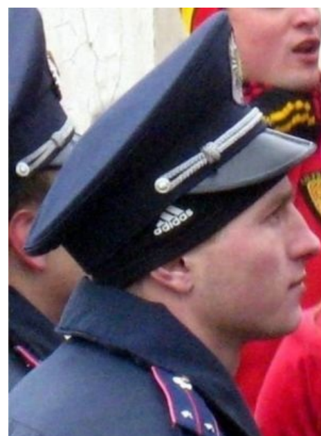
Пацана скрыть нелегко