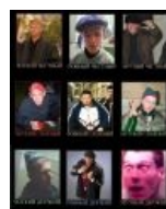
Advanced Drinking & Destruction