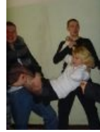
Сегодня будет хоровод