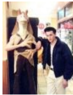
Братья по разуму