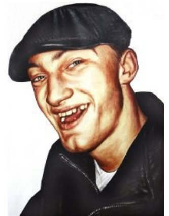
Типичный индивид, напоминающий этого вашего Доши

Нравится это кому-то или нет, но с начала 90-х гопники и основные части их образа жизни ( алкоголь , мат ) стали реальными символами СНГ, вытеснившими в массовом сознании всякие матрешки, балалайки и прочую клюкву . В самом деле, по улицам городов в 90-е гуляли вовсе не медведи, а чёткие пацанчики, носящие совсем не лапти и косоворотки, а кЭпки и палёный абибас.