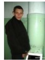
Культурный индивид и писсуар