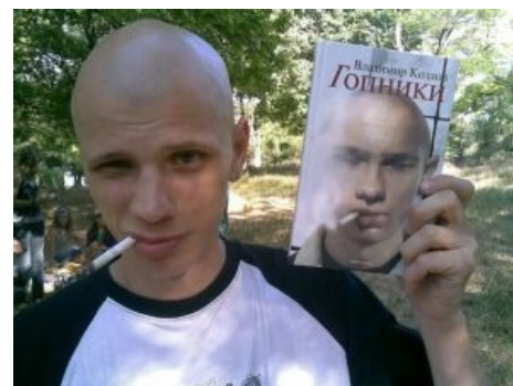
Роман про гопников. Наши гопники — самые читающие в мире