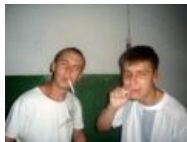
Это был последний снимок прежнего владельца