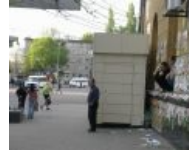
Сегодня будет хоровод