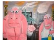
Мы из Кобылозадовска (Автор: Вася Ложкин )