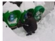
Телефончики для пацанчиков