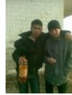
В естественной среде обитания