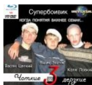
Долгожданный анонс «Чоткие и дерзкие 3»