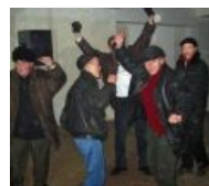
О Боже! Там же Чак Норрис!