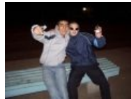
Друг у друга мобилу гопнули