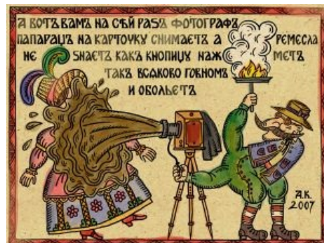
Лубокъ вѣщае суть™

В ответ ей пришло множество комментариев вида «Пожалуйста, прекратите писать книги. Вы должны бы, по идее, понимать, что за отсутствие у вас соответствующих писательских навыков...», но usachev , к сожалению, не пожелал их сохранить для истории.