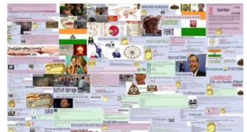
Подборка постов из того самого треда в /int/

Вот такую социальную рекламу на полном серьезе крутят в Индии