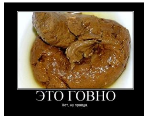
Это говно (с). Нет, ну правда.