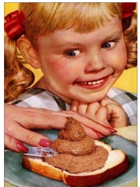
Что-то похожее на сабж.

«Ха-ха-ха! Ох-хо-хо! Дьявольщина, вы думаете, что это? По-вашему, это дристня, дерьмо, кал, говно, какашки, испражнения, кишечные извержения, экскременты, нечистоты, помёт, гуано, котяхи, скибал или же спираф? А по-моему, это гибернийский шафран. Ха-ха, хи-хи! Да, да, гибернийский шафран! Села! Итак, по стаканчику! »