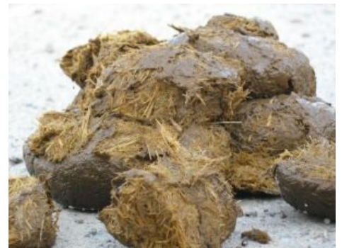
Говно смотрит на тебя, как на себя.