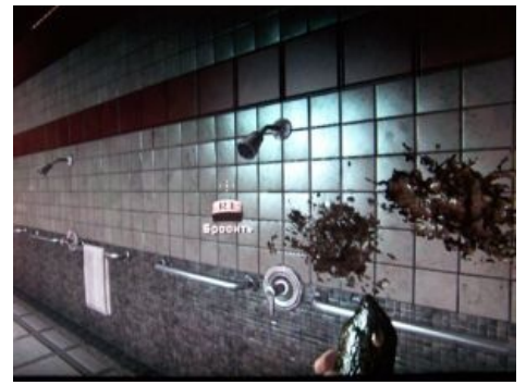
и в Duke Nukem Forever