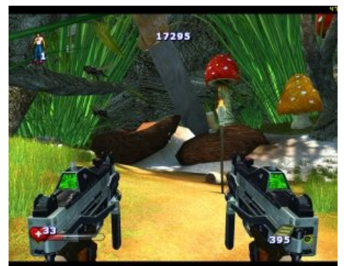
Говно в Serious Sam 2