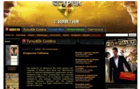
Новость об открытии Гоблача.