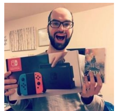
«Nu-male гримаса», характерная для кидалтов