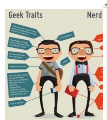
Отличия гика от нерда