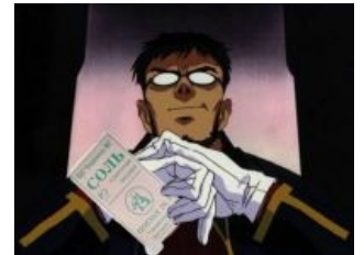
Злой Посол Зол

Когда и как зародилось явление, сказать точно трудно, но сам мем «Evil Ambassador» появился на форчане , как это нередко бывает, благодаря нубизму . Гендо уже во всю проявлял свою мощь и большинство анимуфагов знало, а остальные хотя бы имели понятие, чьи руки, брови и очки подставляются к изображениям. Официального названия тому не имелось — все говорили просто « Gendo Pose » («поза Гендо»), но в один прекрасный тред некий нормалфаг запостил вопрос вида «А что это за тип? Выглядит, как какой-то злой посол». Название пришлось Анонимусу по нраву , и с тех пор так оно и зовётся.