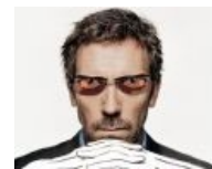
Но это излечимо, Хауз гарантирует!