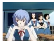
Рей тоже подцепила