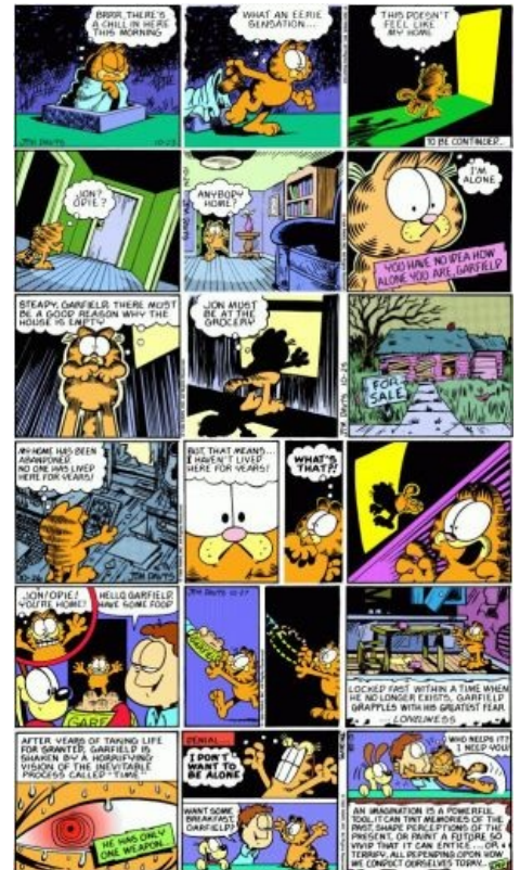
Тот самый стрип.

Некоторых особо вдумчивых интересует порода сего зверя. Выясняют и