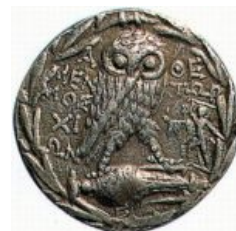
Афинская тетрадрахма с изображением «Тираноубийц»

Да, вечная слава вас ждёт и потом, О, милый Гармодий с Аристогитоном, За то, что тирана сразили мечом И равными сделали всех пред законом.