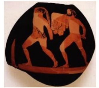
Гармодий и Аристогитон на аттической вазе V века до н. э.