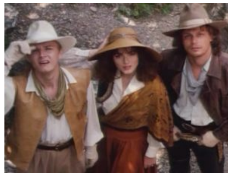
Гардемарины в Южной Америке

У тебя старушка-мать В русской деревушке, Но тебе важней слышать, Как стреляют пушки, Чтоб на мостике стоять В чине капитана, Чтоб Россию защищать От зла и обмана.