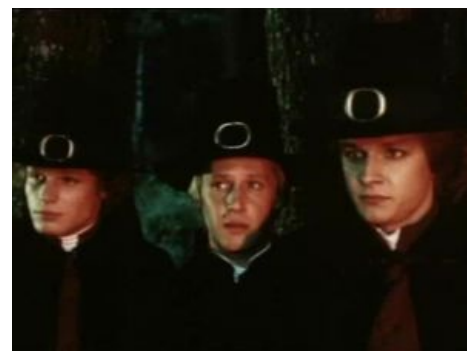
Крутые парни носят чёрное

А кроме того, гардемаринны — три долбёеба киноперсонажа, завербованные Императорской Тайной канцелярией для секретных поручений на благо илиты этой страны . Александр Белов, Алексей Корсак и Никита Оленев — герои позднесоветского и раннероссийского кино. Кумиры подростков и наш ответ нашим же «Трем мушкетерам». Всего фильмов было три: винрарный «Гардемарины, вперёд», неоднозначный высер «Виват, гардемаринны» и постсоветский говнофильм «Гардемарины-III». О них и пойдёт речь.