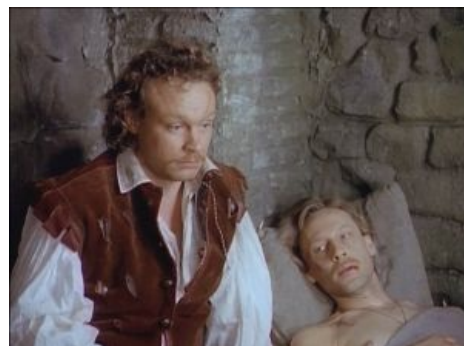
Гардемарины в средневековой Франции