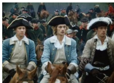
Гардемарины уже не те