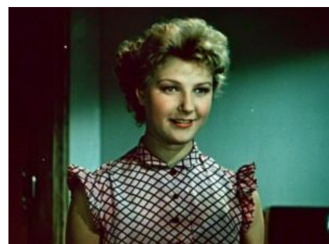
Режиссёр в молодости была вполне фапабельна