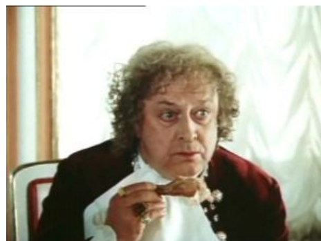
Лесток жрёт курицу, а русские крестьяне голодают