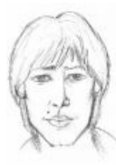
Удали родинку, сука!