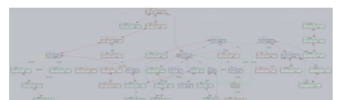
Гандам — это просто

https://www.youtube.com/watch?v=hUBMTiIk-qc Какбэ суть