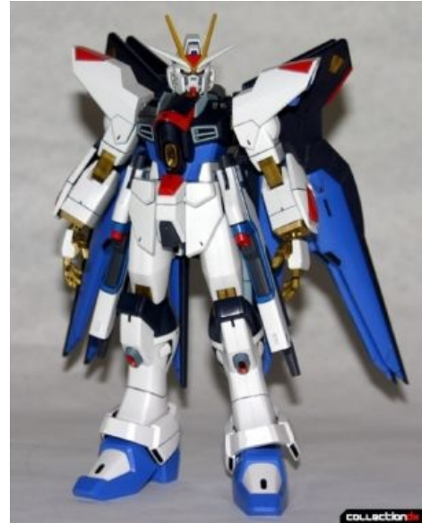
Японская расовая моделька ZGMF-X20A Strike Freedom Gundam

«Гандамы» как сборное понятие для всех сюжетных линий — типичный мультиверс. Практически каждый сериал описывает свой мир, отличный от имевшегося ранее, но построенный по определенным канонам. Гандамовских сериалов, а соответственно миров много . Даты указываются в некоем абстрактном календаре, скажем год «0079 FC». Здесь FC занимает место стандартного префикса AD, «нашей эры». К сожалению, текущий гандам ломает эту традицию. Из-за чего среди гандамнубов наблюдаются индивидуумы, уперто считающие все гандамы одной вселенной, хотя почти каждый таймлайн(кроме AW и CC) начинается с нуля, то есть с какого-то года А. Д. Вот. На сам гандамовский АД это не