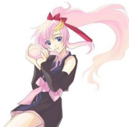
Лакс няша же

Если глядеть со стороны, то Сид ничем не хуже предыдущих Гандамов, да, хотя и ничем не лучше. Целился Санрайз на подростковую ЦА — так это и не мудрено, за 30 с гаком лет после 0079 бывшие поклонники уже стали дядьками с пивным пузом и в майках с Евой, а новую аудиторию надо окучивать. Сериал же от этого ничего не потерял — и школоте нравится, и ценители найдут в нем что-то себе по нраву, а кто-то может и поностальгирует о временах, когда солнце светило ярче, небо было выше, а гандамы были не чета нынешним. Другое дело, что та же школота начинает буйствовать в духе «OMG TEN BEST ANIM3 EVAR!!!111», справедливо вызывая у окружающих чувство бездны анальной оккупации — но у фанатов градус неадекватности и так всегда того, хоть на евафагов посмотрите, а сам сериал от этого хуже не становится.