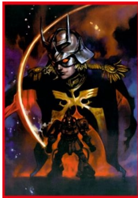
Чар Азнабль, человек и ходячий мем, родоначальник всех блондинов в масках

Алсо, Чар Азнабль — сам по себе ходячий мем [2] .