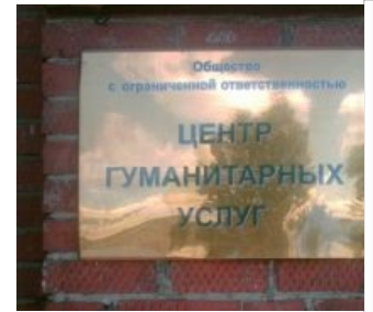
Пример из Красноуфимска