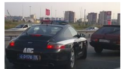
ДПС в Пореврик-сити