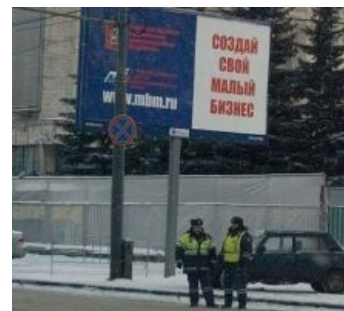
У них хороший стартовый капитал