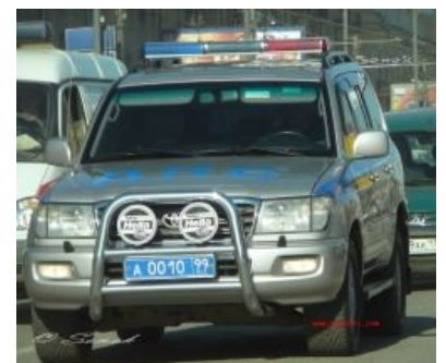
Скромный труженик УГИБДД Москвы