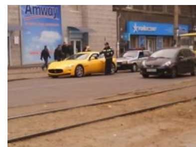
Если вы в жопу пьяный мажор, прижмите руку инспектора стеклом, пока родители подвезут побольше бабла

Как бы ни сложилась ситуация, оставайся вежлив и спокоен. Менты, как и все люди, неадекватов не любят, а на грубость отвечают грубостью. Также не стоит показывать, что ты торопишься, даже если на самом деле опаздываешь. Инспектора могут решить, что ты хочешь свалить побыстрее, пока не накрыло с химии или не завонял труп в багажнике.