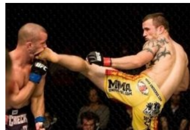
В рот тебе ноги IRL