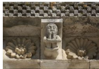
Средневековый сабж в одиночном исполнении