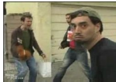
Сабж на фоне Дэвида Блэйна