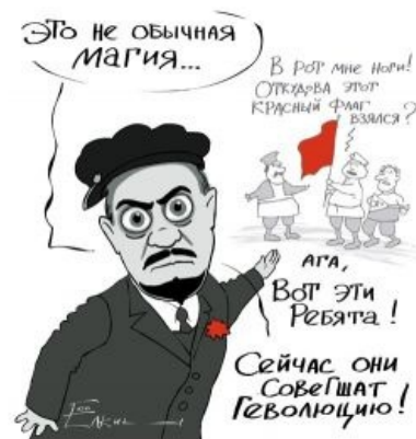
Ленин и революция