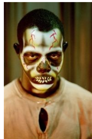
For Glory Of Metal Warriors!

Лоа — дагомейское слово, обозначающее тех самых духов. Имеется также йорубанское оришá — синоним, но неполный, пантеоны, в силу родства самих народов, пересекаются и взаимопроникают, но не совпадают. Дагомейцами торговали, в основном, французы, а