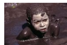
А я люблю обмазываться...