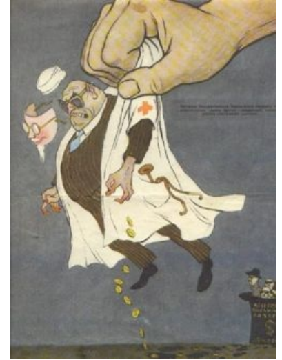
Сначала суть была такова

Также сюда можно добавить интересные факты, картинки и прочие кошерные вещи.