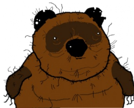
Вонни сбстнй прсной

Комиксы про Вонни отличаются в первую очередь уникальной и непередаваемой атмосферой русской действительности . В чёрно-белых деревенских , индустриально-мусорных , а порой даже постапокалиптических местах искажённые герои мультфильмов про Винни-Пуха и всех-всех-всех влачат своё полное боли существование. Российские реалии смешиваются с тяжелыми веществами, что имеет несколько иной эффект, нежели превращение мира в звёздную раду гу. Позже к Вонни и его друзьям подтянулись другие известные персонажи советских мультфильмов, а также Смешарики и даже пони (последние, правда, особой популярности в сеттинге Вонни не снискали; у них свой ад есть). Юмор бывает разный, но в большинстве случаев мерзотен и черен, как душа битарда, создавая то самое ощущение безысходности и отчаяния.