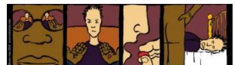
I show you how deep the rabbit hole goes.