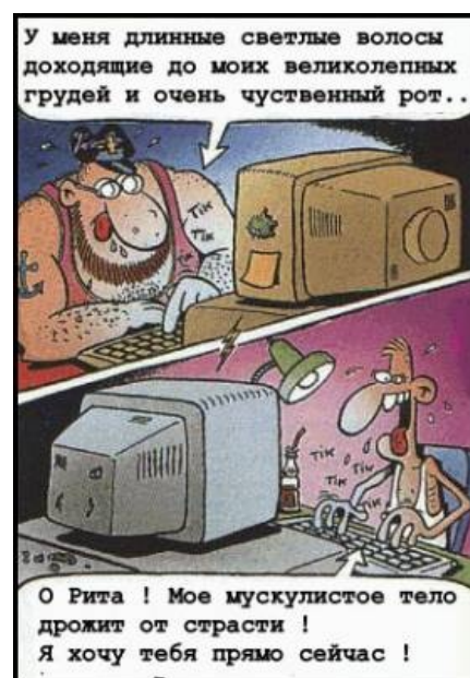
В большинстве случаев это выглядит так