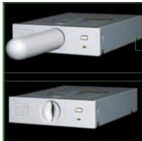
Приспособа для вирта в стандартный 5-дюймовый слот, мужской и женский варианты