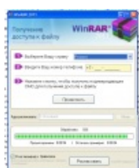
Wait.. ОН SHI~~