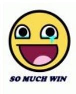
So much win

Тысяча победить. Эрис Вин по-русски, написанный китайцами