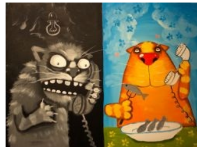
Ложкин, «Ваш звонок очень важен для нас!»

ДОЗВОНИЛСЯ ДО ТЕХПОДДЕРЖКИ, СКАЗАЛ: «НАШ ЗВОНОК ОЧЕНЬ ВАЖЕН ДЛЯ ВАС, ДОЖДИТЕСЬ ВОПРОСА АБОНЕНТА» И НАЧАЛ ТИХО ИМПРОВИЗИРОВАТЬ НА РОЯЛЕ.