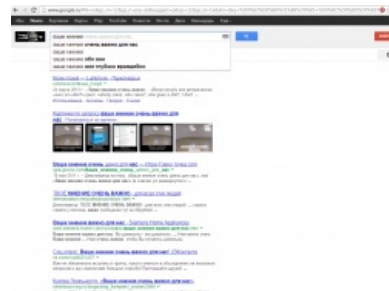
Гугл в курсе